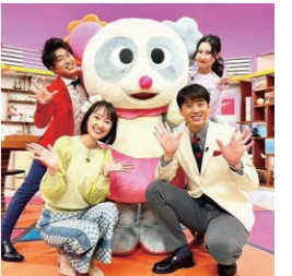
BSNテレビ「水曜見ナイト」水曜19:00～

亡くなった父との『絶対アナウンサーになる』という約束と、私自身があきらめたくなかった憧れの仕事。みんなでいいものを作り上げていくのが醍醐味です。周りの人たちに恵まれていると感じています。